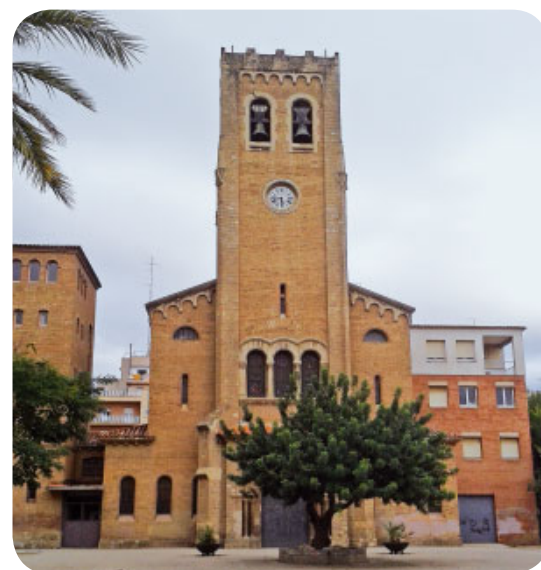
Església de Crist Rei de la Sagrera (Barcelona)

Per a més informació: justiciaipau@justiciaipau.org